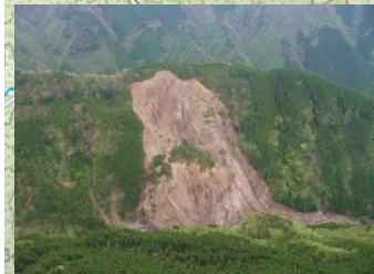
山腹崩壊(小井谷) H27.4撮影