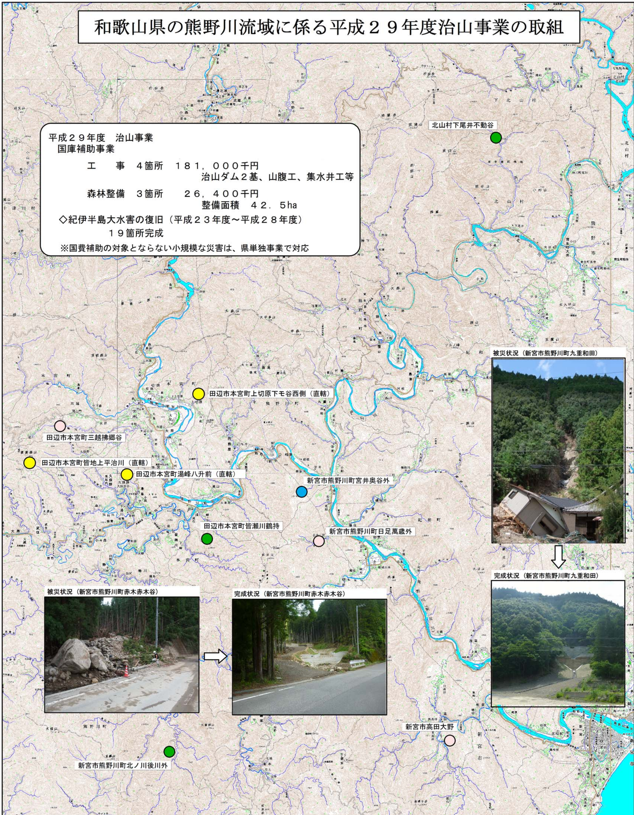
被災状況（新宮市熊野川町九重和田）