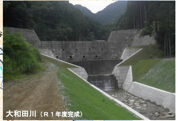
大和田川（R1年度完成）