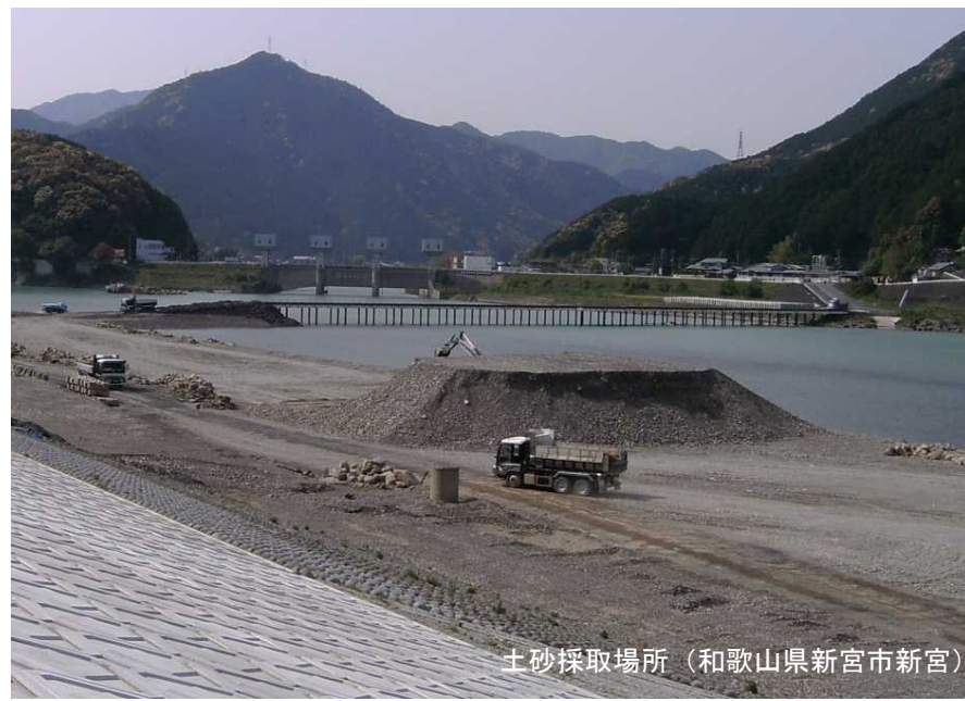
土砂採取場所 (和歌山県新宮市新宮)

※採取は、河川管理者が土石採取場所に仮置した掘削土石を土石採取者に採取させるものです。