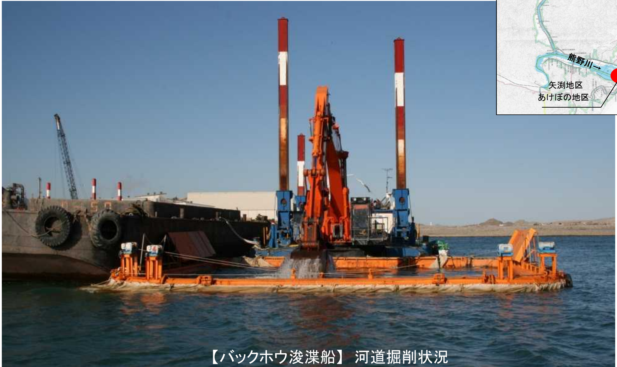
【バックホウ浚渫船】 河道掘削状況