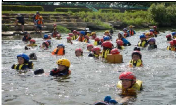
さばえかわらぶ2019 学ぼう！遊ぼう！河原でGO！ (R1. 8. 6)

リバーパラダイス そうだ川に行こう！「おしゃれなり・BAR」マイテントキャンプ の開催