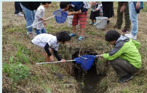
「加陽湿地まつり」で水辺の普及活動(生きもの調査)