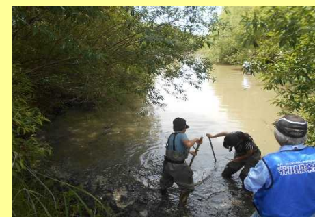
唐崎わんど観察会(R1.6月)