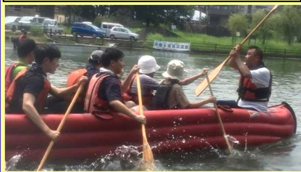
各種団体とのフォーラムの共催(R1.7月)