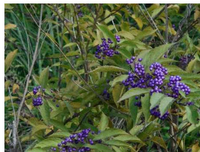
コムラサキシキブ