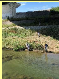
ミズヒマワリ調査(R1年度 計2回)