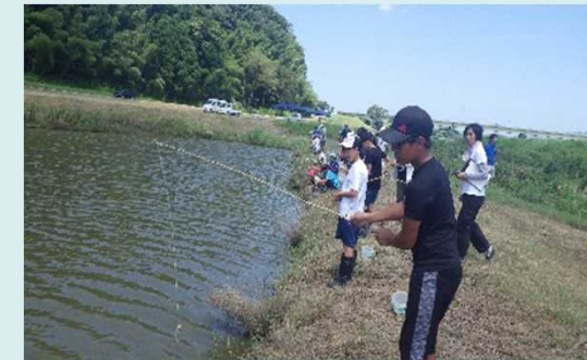
地元小学生等の環境教育を兼ねてのザリガニ釣り