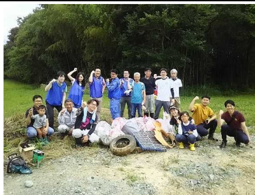
由良川クリーン活動