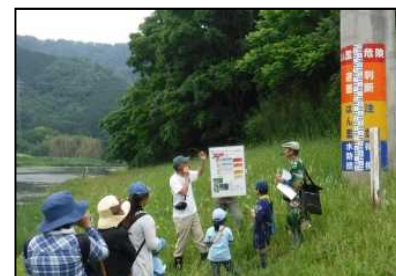
ネイチャービンゴをしながら名張川ウォーキング(R1.6月)