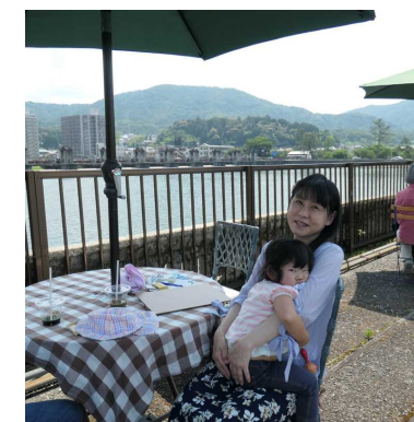
毎月第四土曜日の定例オープンカフェ開催時 スタッフ写真／来訪者の様子／来訪者の様子