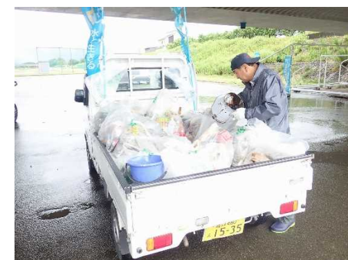
クリーンアップ大作戦(R1.6.16)