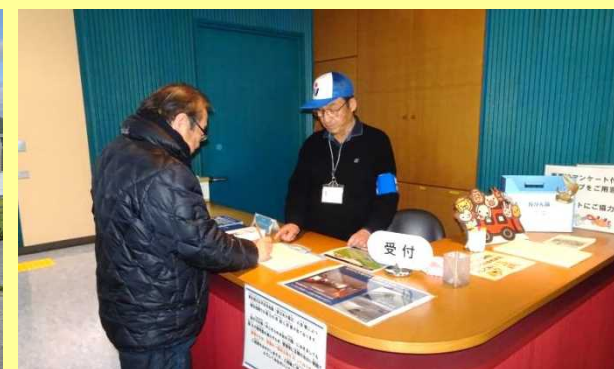
▲受付にて来館者へ案内