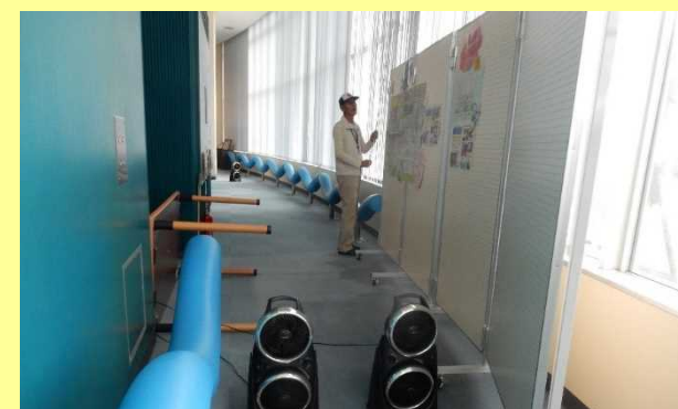
▲開館の準備をしている様子