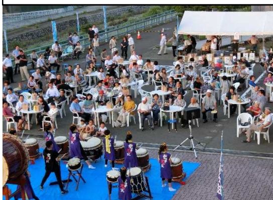
ミズベリング九頭竜川に乾杯 (R1.8.2)