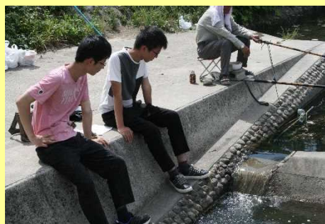
アユの遡上調査(H31.4月～7月)