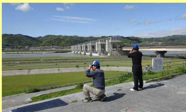
▲動植物採捕禁止区域の巡視