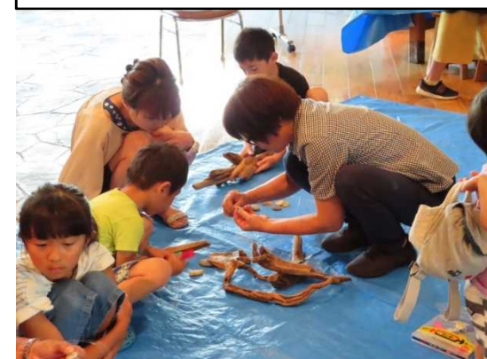
九頭竜川に親しむ会 (R1.8.11)