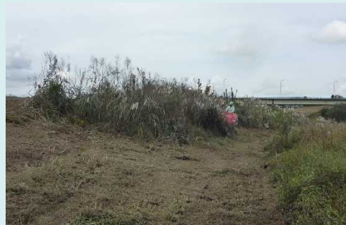
湿地に繁茂する外来植物の駆除