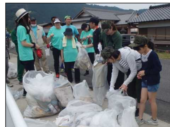
名張クリーン大作戦(R1.6月)