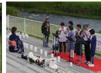
水辺で乾杯 演奏会(R1.7月)