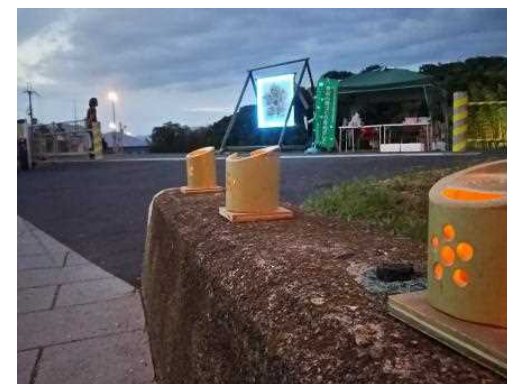
桔梗の紋章光のミニユメントと光秀藪ライトアップ