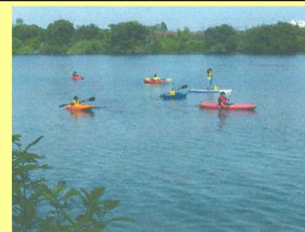
淀川まるごと体験会(R1.8月)