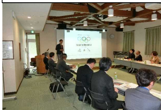
九頭竜川河川空間利用に関する 意見交換会 (H31.4.24)