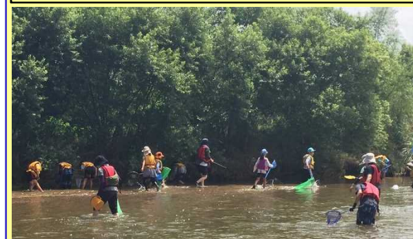
市民向け流域学習会(R1.7月)