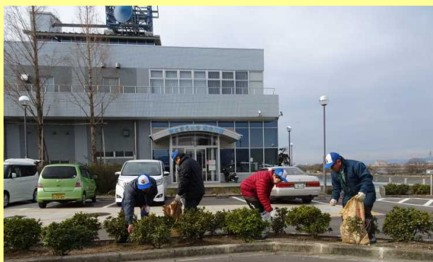
▲駐車場を清掃している様子