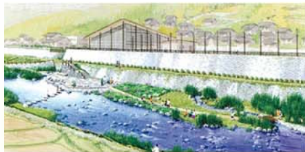
水辺整備イメージ (宇陀市室生区三本松)

● 地域住民が水辺に親しみ、学習等に活用する「水辺の楽校」整備を住民・住民団体と連携して実施します。