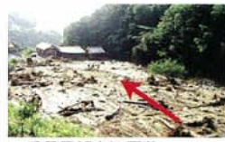
三重県伊賀市津元谷