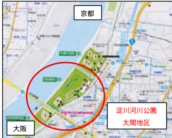
周囲の更新状況と老朽化施設状況