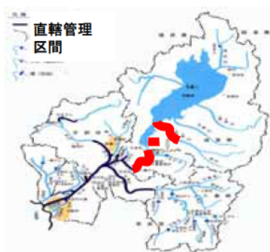
○河川水辺の国勢調査 (調査状況)