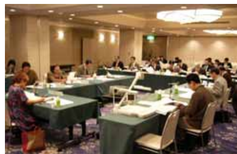
第6回委員会の様子