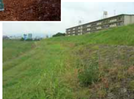
→ 植生の復元 状況(5年後)