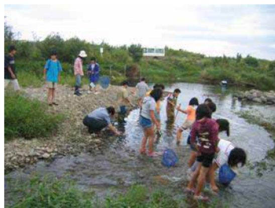
住民参加によるワンドの 自然環境の観察の様子