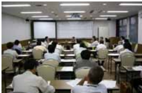
第5回委員会の様子