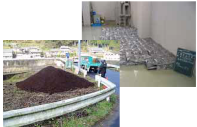
試行的に堆肥を配布