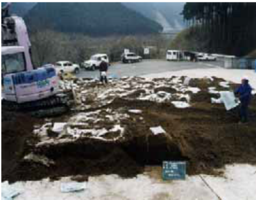
流木を破碎後、堆肥化