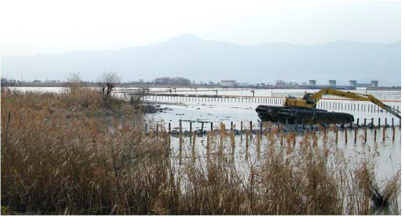
津田江の東北部の造成工事中。情緒のあった水辺が直線化される光景