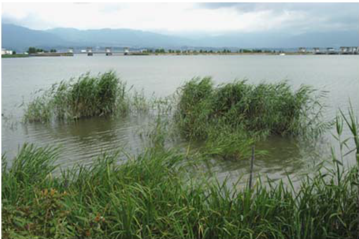
ヨシ帯造成事業以前の正常な葦の姿