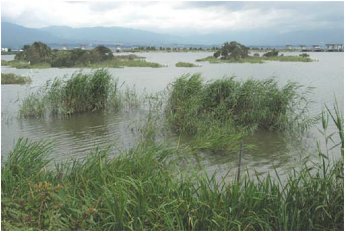
シミュレーションで作成した 景観創りにも役立つ造成事業案 沖に 柳などまざった葦群落でできた小さい島