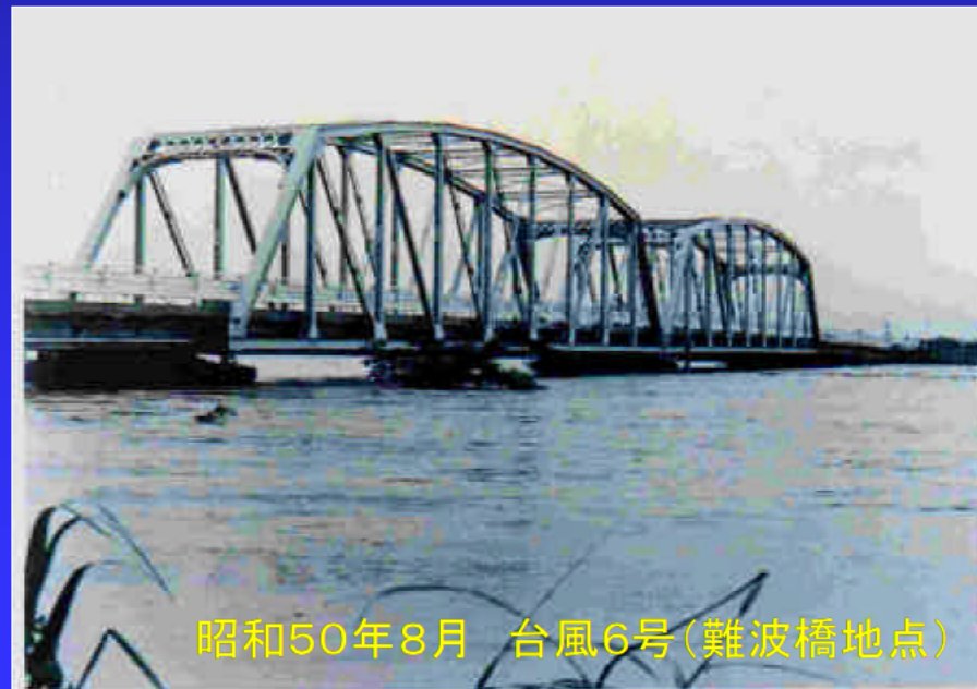
昭和50年8月 台風6号(難波橋地点)