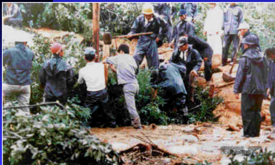
(S.50.8 6号台風時の水防活動 びわ町錦織地内)