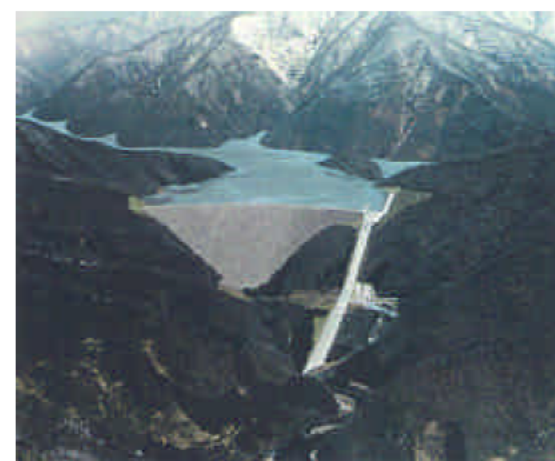
丹生ダム完成予想図

丹生ダム本体着手に向けて工事用道路並びに県道杉本余呉線及び県道中河内木之本線道路改築工事を実施しており、今年度も引き続き道路工事を実施していきます。