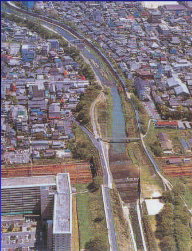
天井川である草津川現川(JR琵琶湖線トンネル)

草津市の中央部を流れ、琵琶湖に注ぐ草津川は、全国でも代表的な天井川です。河床は市街地の地盤から平均して5~6mも高いところにあり、道路や鉄道は川の下をトンネルで通過しています。