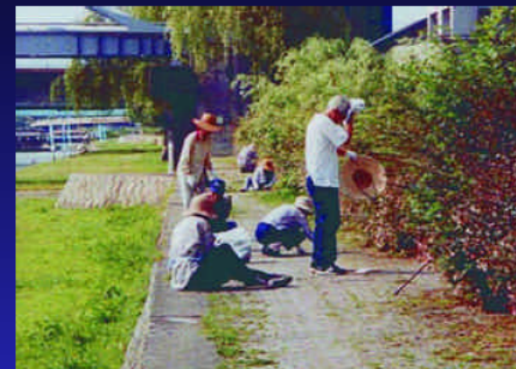
清掃作業中(盛越川)