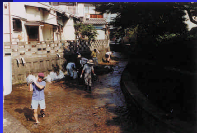
清掃作業中(盛越川)