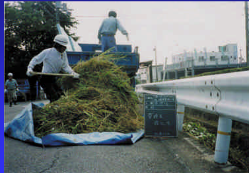
処分の様子(篠津川)