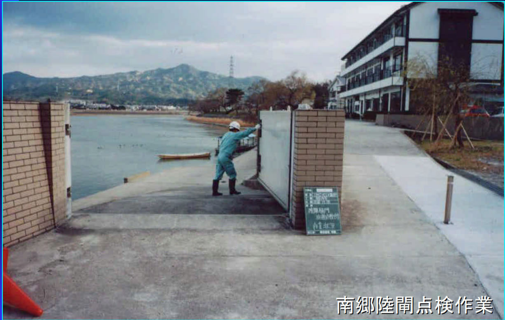
南郷陸閘点検作業