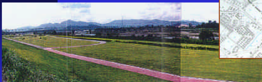
③野洲町立運動公園

野洲川には、守山市、野洲町、栗東町がそれぞれスポーツ系を中心とする野洲川公園が整備されており、野洲川を代表する一つの景観となっています。