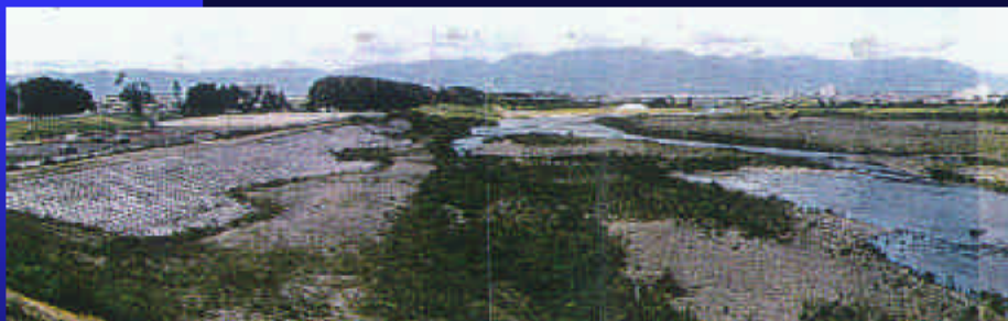
⑤多自然型護岸と 栗東町立運動公園