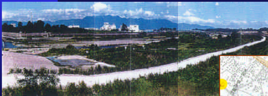
①落差工と比良山系