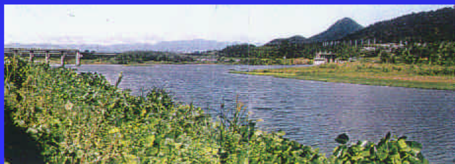
⑧石部頭首工と上流の湛水部