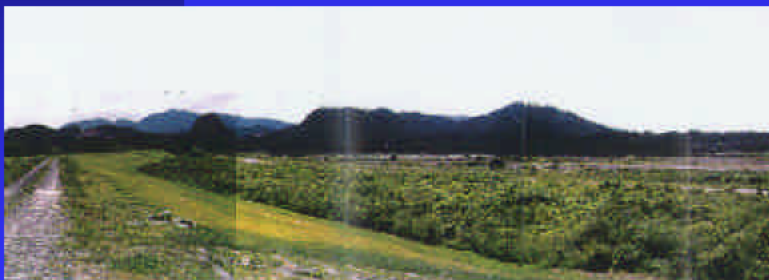
⑦三上地区の緩傾斜堤防