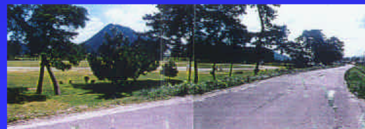
④野洲川の景観を代表する高水敷の松林と三上山

野洲川には、守山市、野洲町、栗東町がそれぞれスポーツ系を中心とする野洲川公園が整備されており、野洲川を代表する一つの景観となっています。