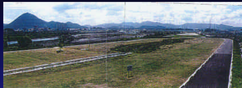
②三上山とダイバーシティロード(緊急用管理道路)