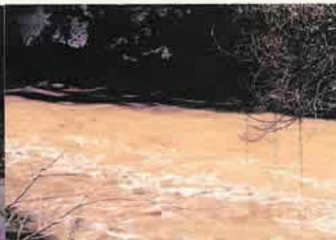
高時・杉野合流点