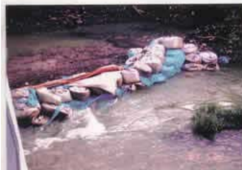
上丹生上流 丹生ダム道路工事