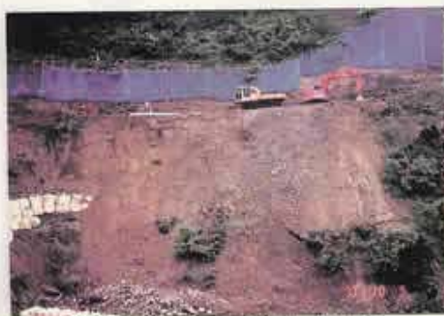
道路すぐ下が丹生川