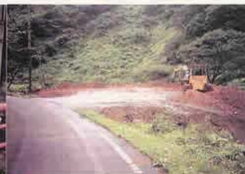
土捨て場すぐ近く川