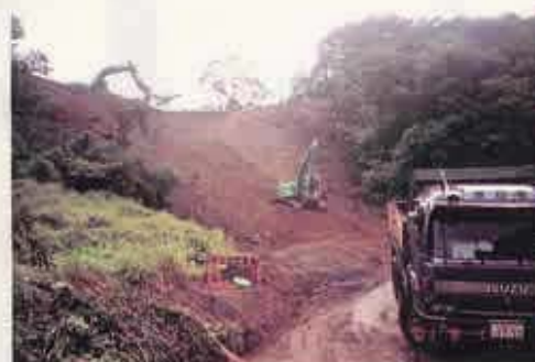
中河内より下流で