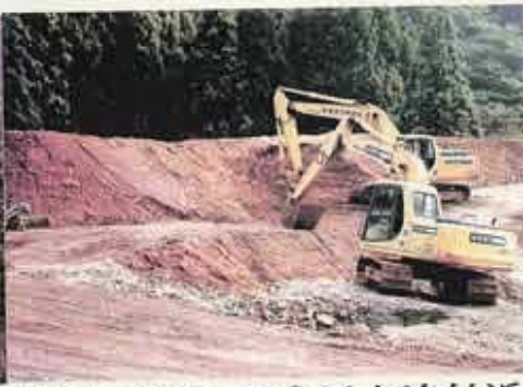
奥川・並川・丹生川合流付近