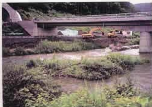
トンネル工事・護岸工事