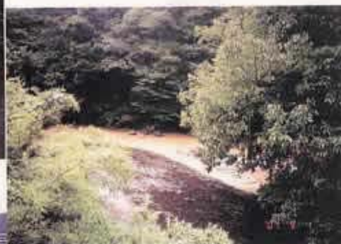
高時・杉野合流点