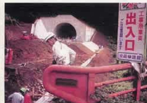
すぐ右下が高時川