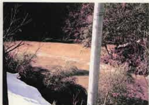
高時・杉野合流点