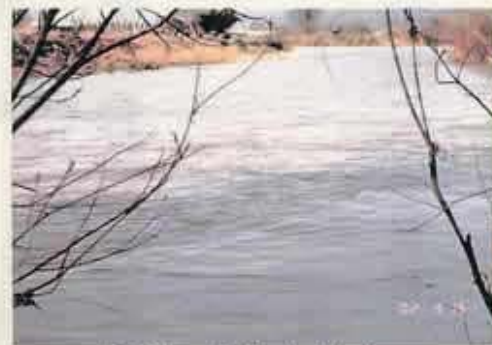
姉川・高時合流点