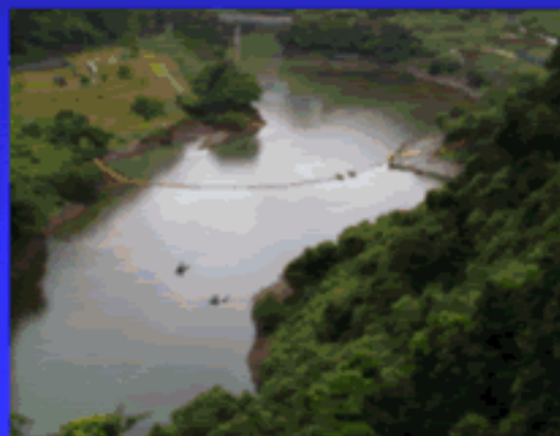
バス釣り(青蓮寺ダム)