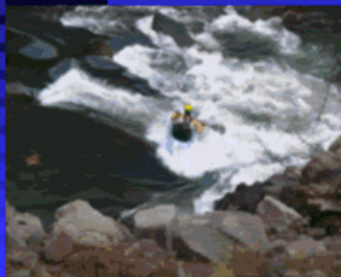
瀬田川洗堰下流 【第1稿 P23】