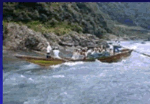
嵐山・三船祭り(桂川)