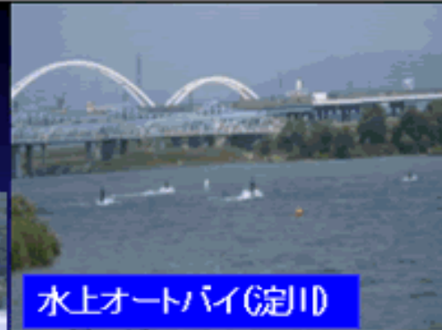
水上オートバイ(淀川)