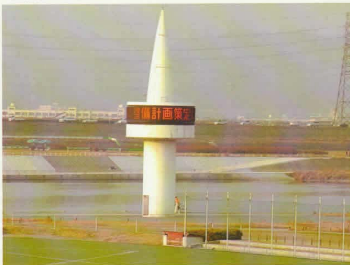
枚方量水塔電光掲示板