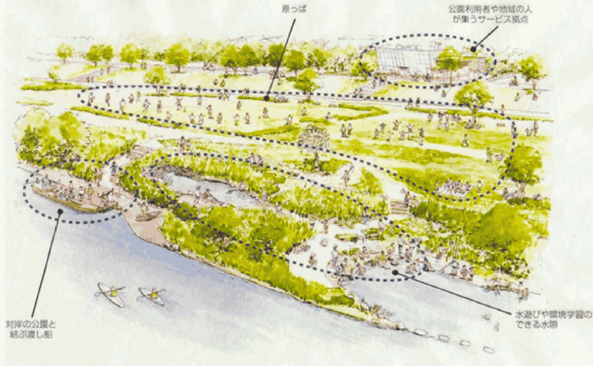
淀川河川公園フォローアップ委員会資料より抜粋