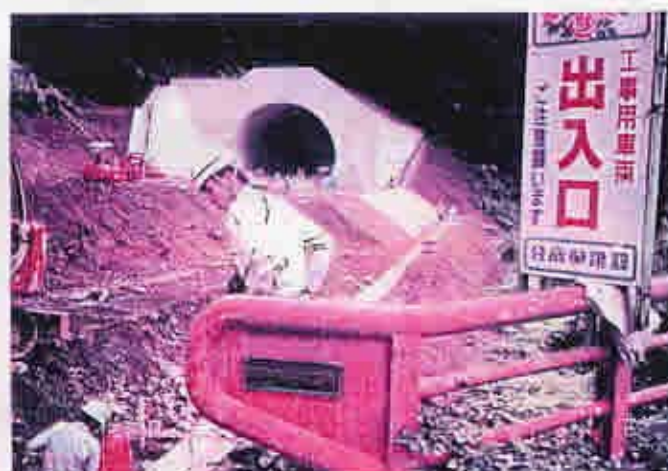
すぐ右下が高時川