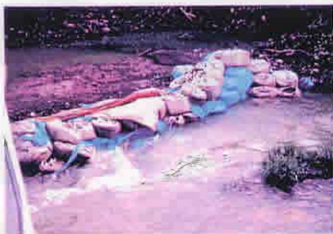
上丹生上流 丹生ダム道路工事