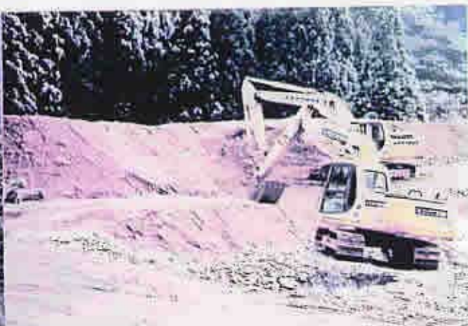
奥川・並川・丹生川合流付近