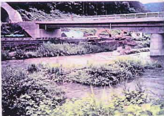
トンネル工事・護岸工事