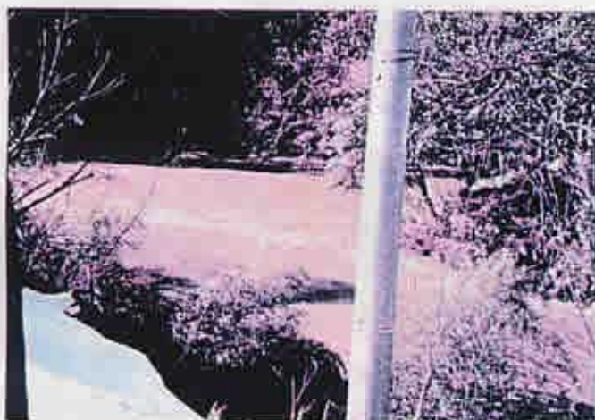
高時・杉野合流点