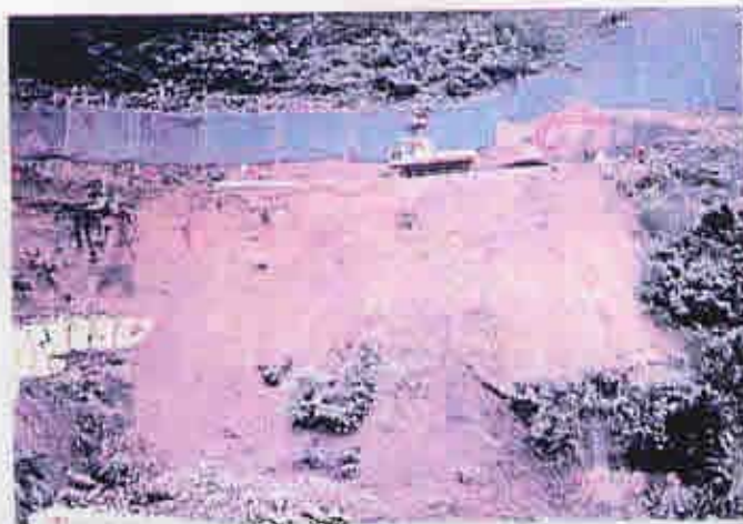
道路すぐ下が丹生川