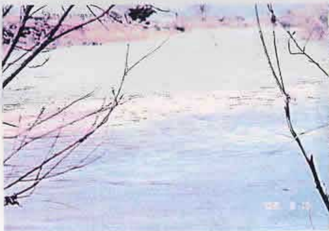
姉川・高時合流点