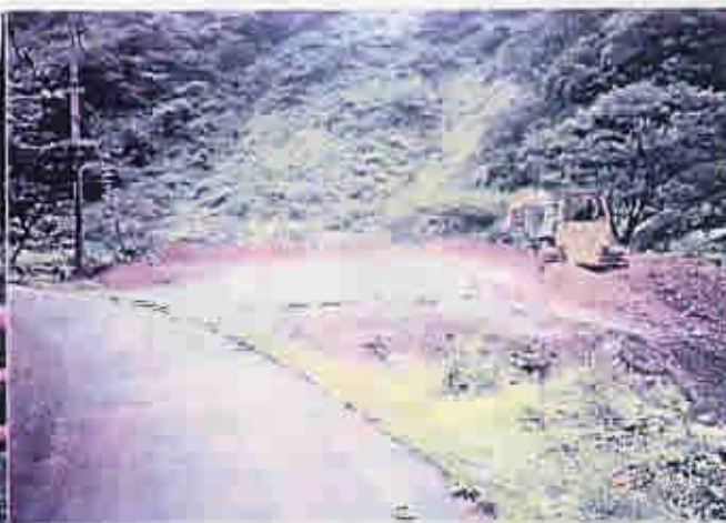
土捨て場すぐ近く川