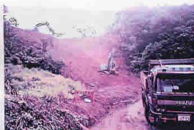
中河内より下流で