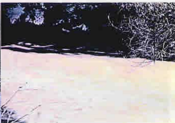
高時・杉野合流点