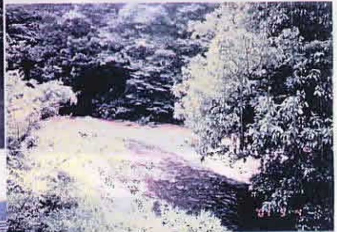
高時・杉野合流点