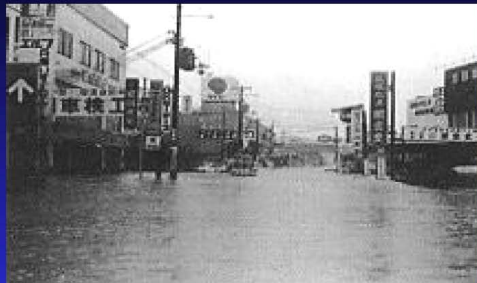
川西市東多田鼓ヶ滝橋付近