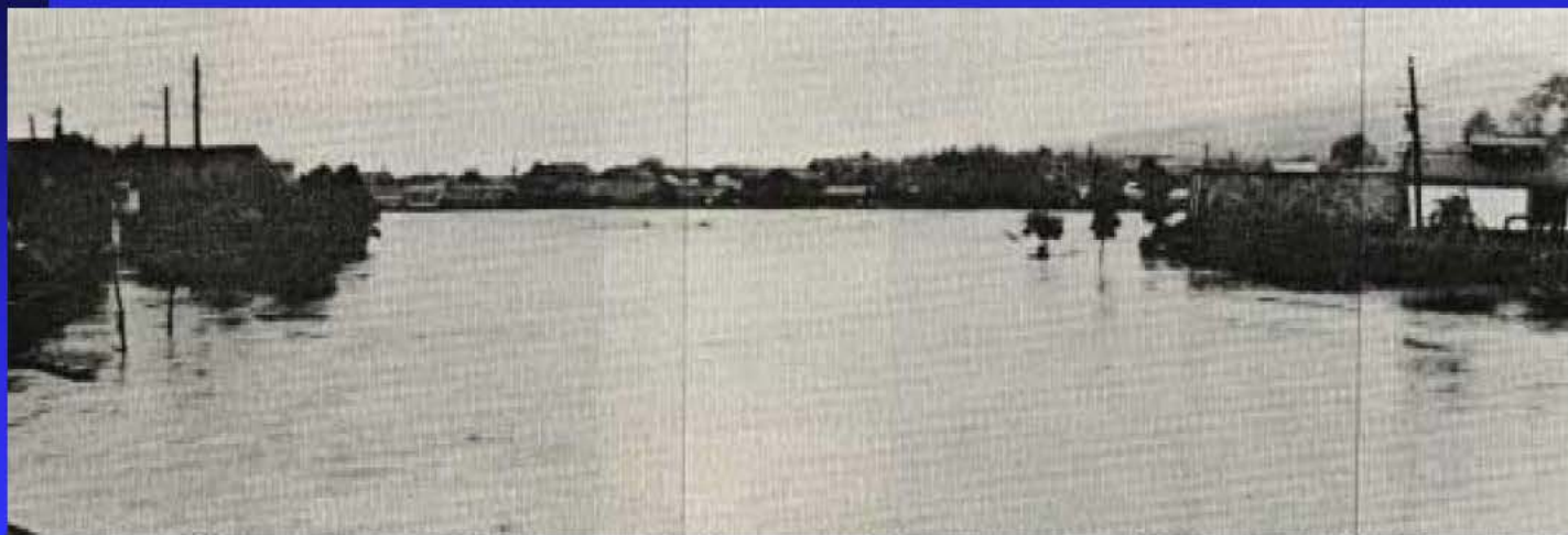
池田市中の島地区の増水状況