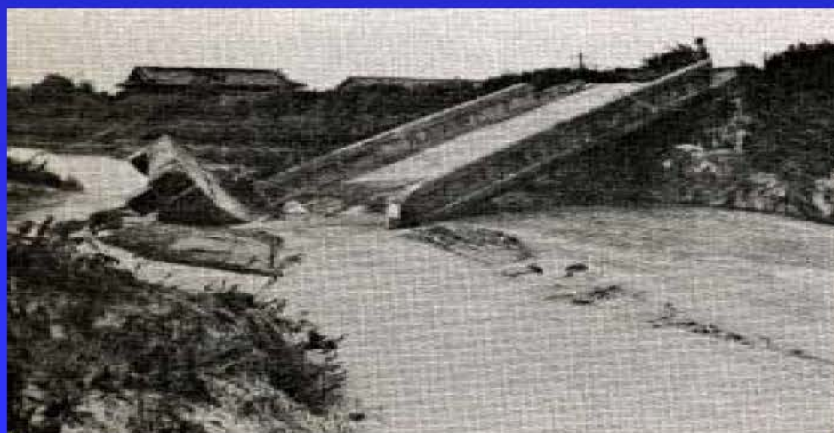
千里川 下走井橋被害状況