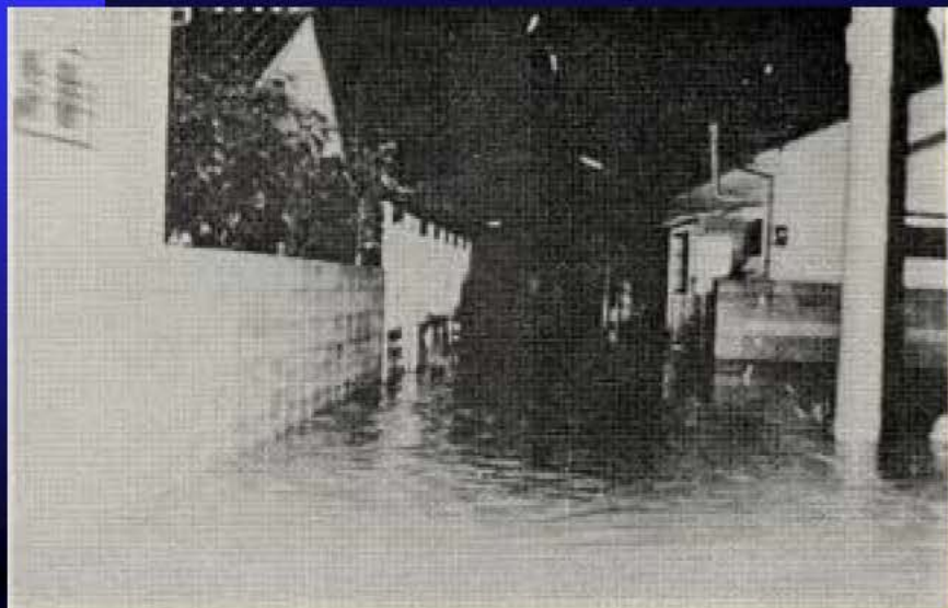
泥海と化した新興住宅街(川西市 寺畑)