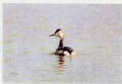
カンムリカイツブリ ◎

写真出典 ○：三宅博写真集「野鳥放策」(著作権フリー) ◎：(株)里と水辺研究所提供