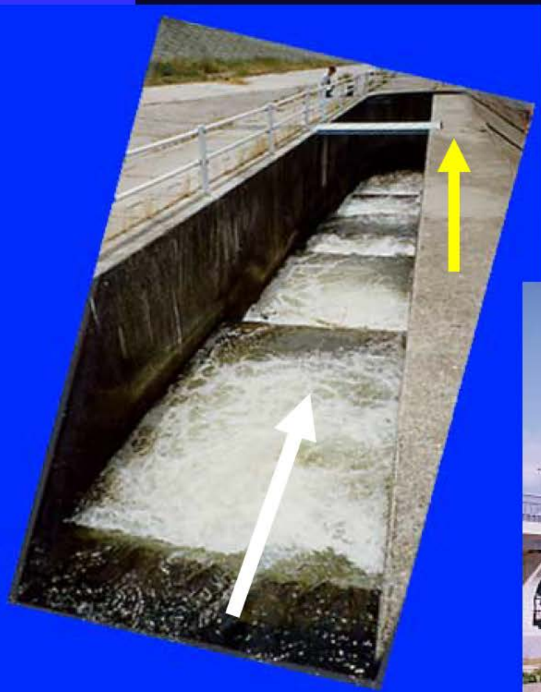
池田井堰 魚道 ( 11.0k地点 )