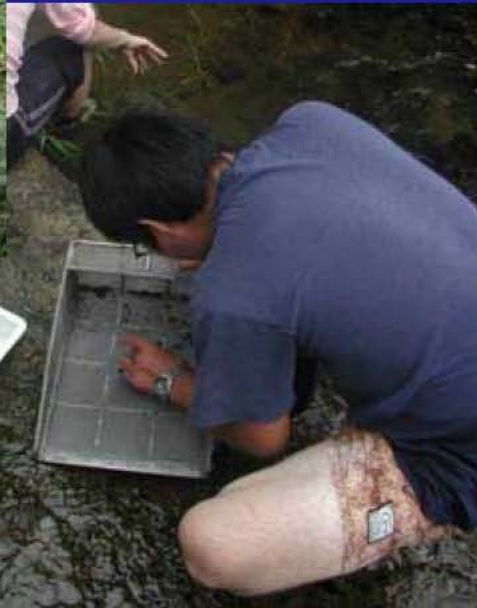
← 水生昆虫 採取の様子