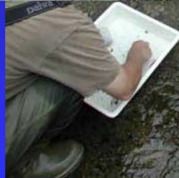
付着藻類採取の様子 →