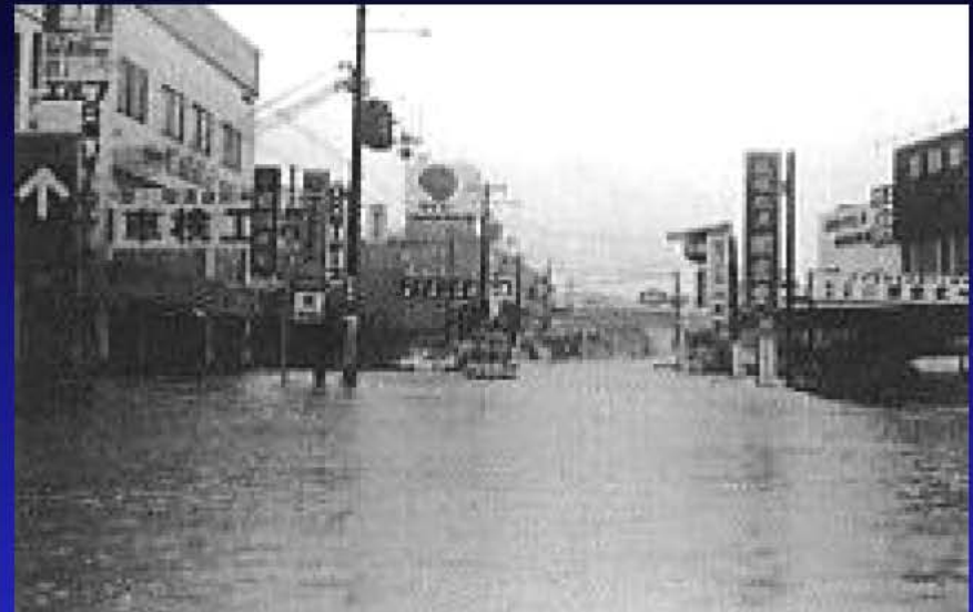
川西市東多田鼓ヶ滝橋付近