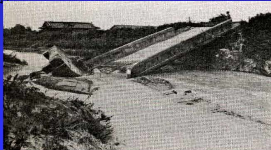
千里川 下走井橋被害状況