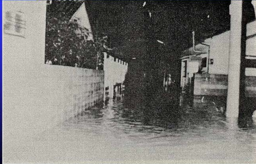
泥海と化した新興住宅街(川西市 寺畑)