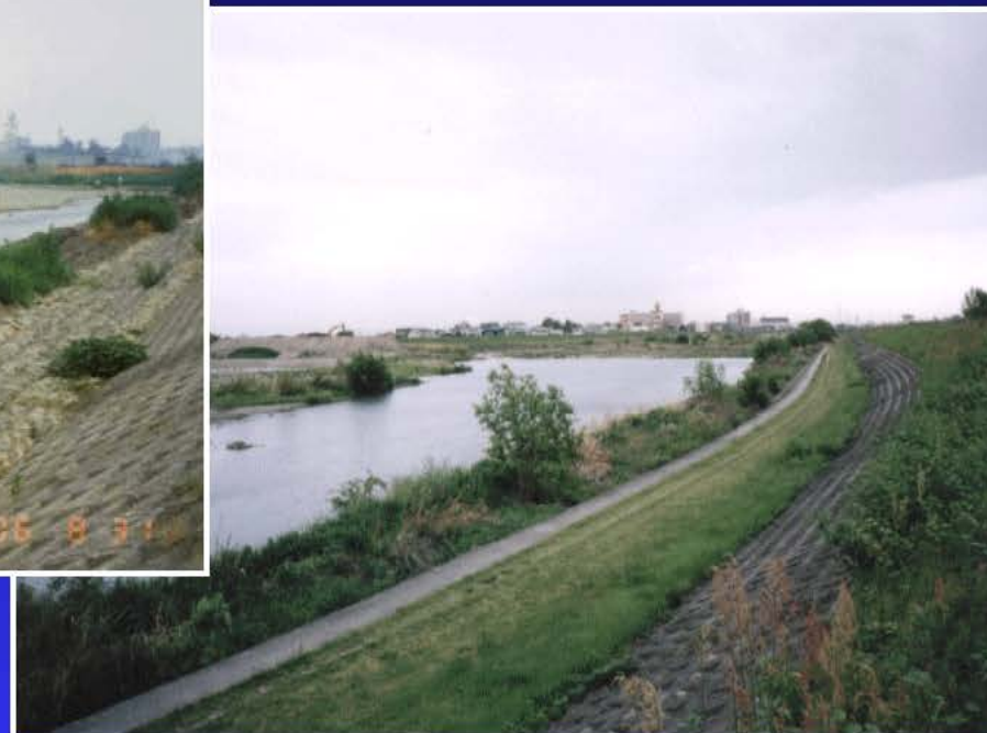
通常時の三ヶ井井堰付近 (H13. 5. 7)