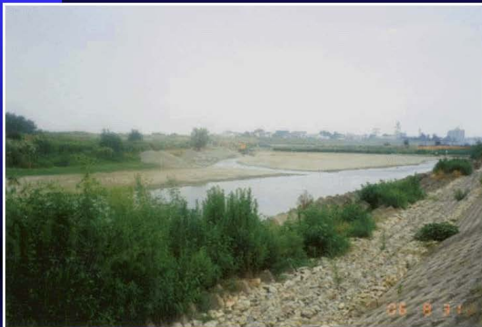
渇水時の三ヶ井井堰付近 (H6. 8. 31)