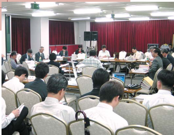
【天満研修センターにて】