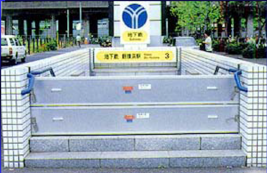
地下鉄入り口の防水扉