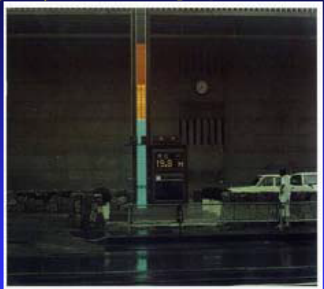
岐阜市庁舎前水位表示標