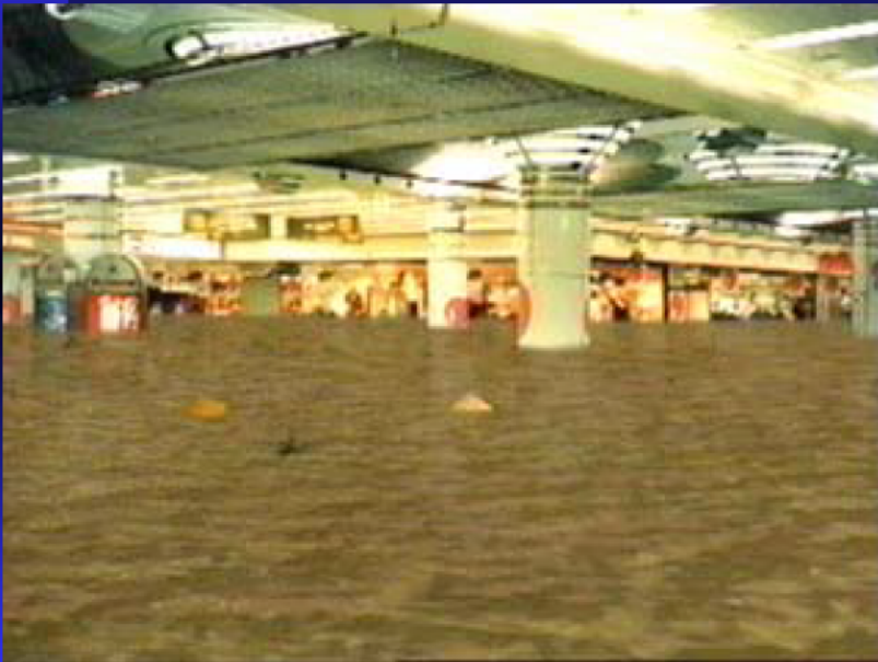
地下街での氾濫流