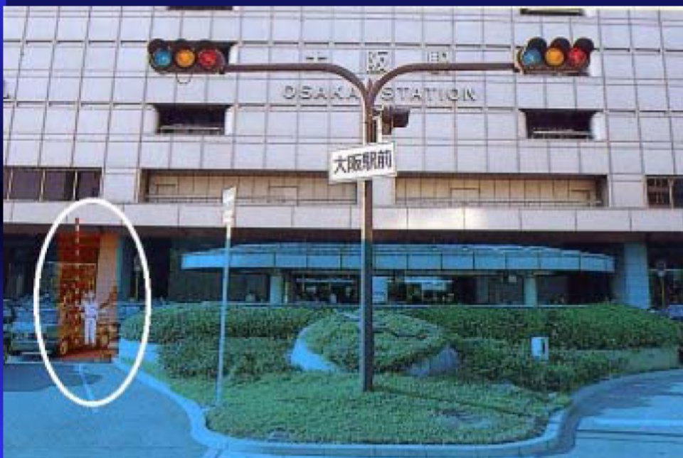
浸水イメージフォトモンタージュ(大阪駅)