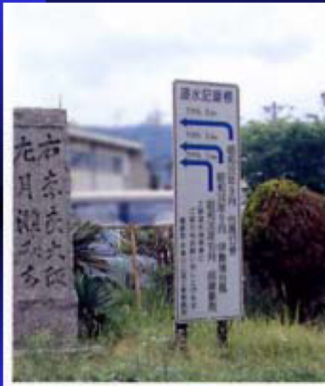
木津川筋における『鍵屋の辻』 の実績水位表示