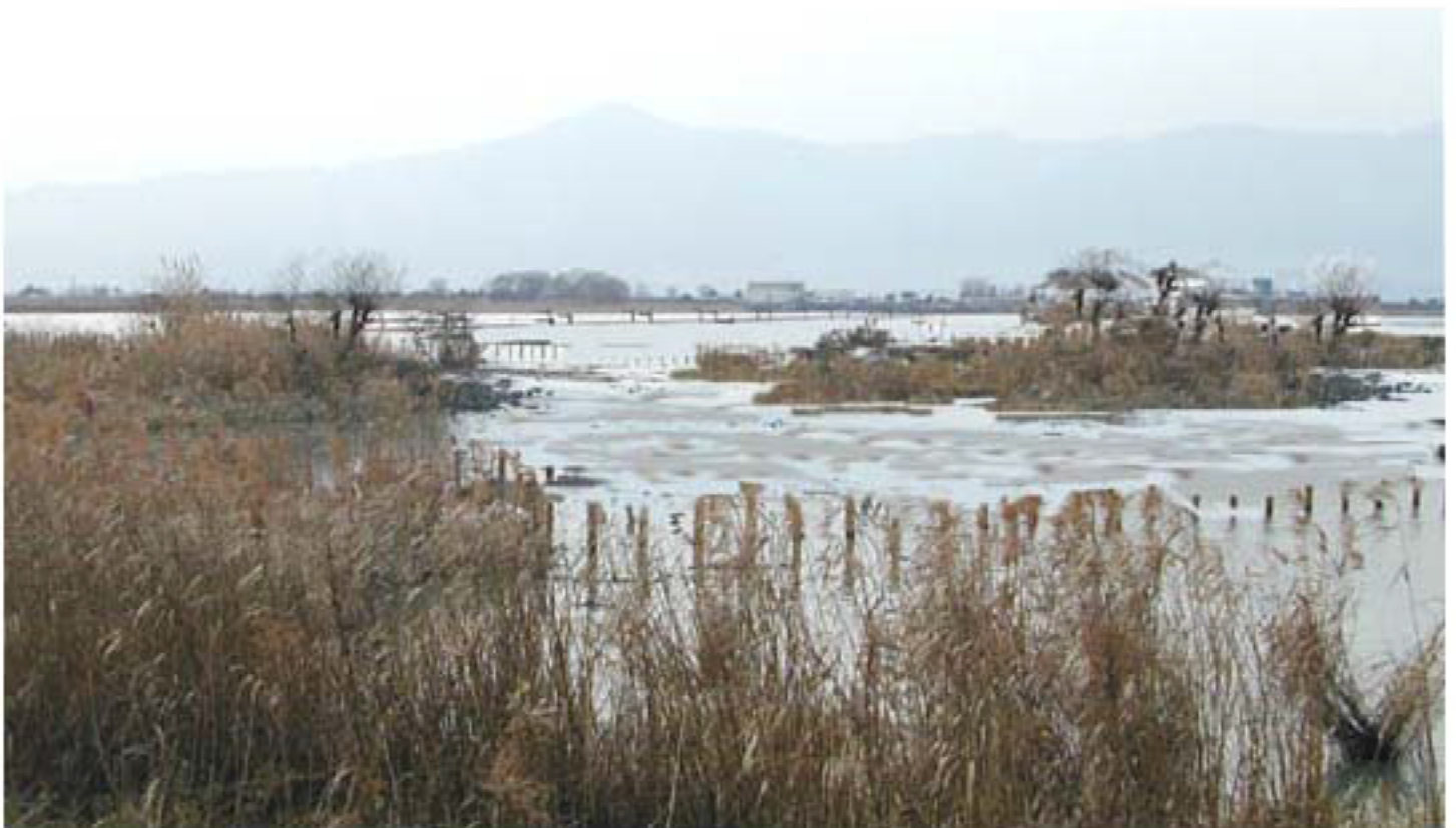
シミュレーションで作成した、より望ましい葦帯造成案。 葦のみの単純化された生態系より 柳など他の植物も混ざったバリエーションの 豊富な葦群落。美しい不規則的な曲線で 景観復元にも役にたつ