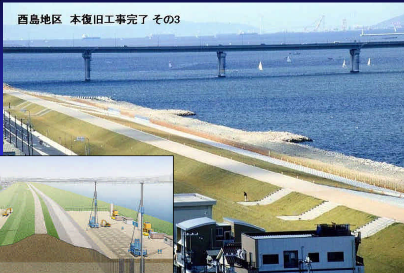
西島地区 本復旧工事完了 その3