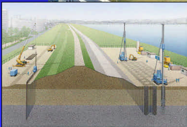
耐震対策イメージ