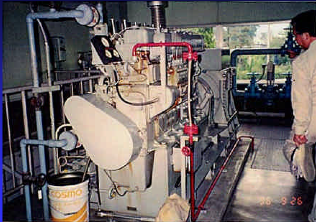
小田排水機場の点検