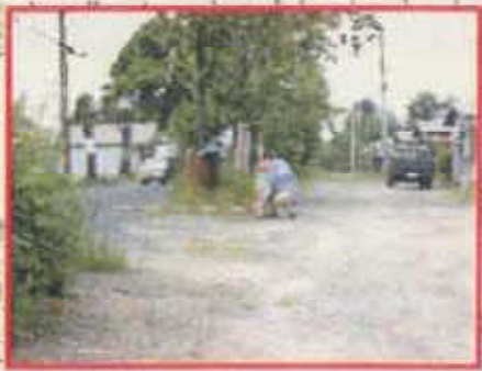
地盤高 約84.8m (B. S. L. 0.4m)