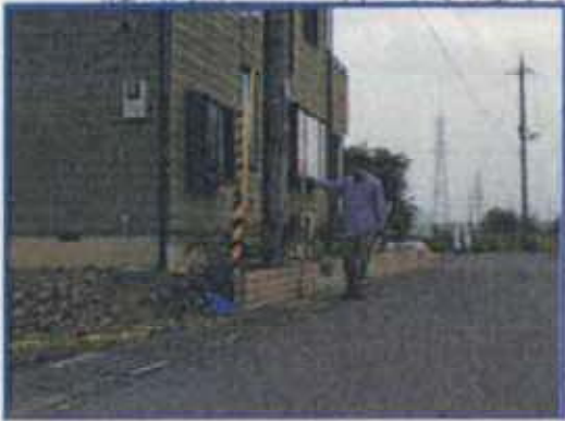
道路 約85.1m(B.S.L 約0.7m) 家屋敷高 約85.5m(B.S.L 約1.1m) 補正值 0.4m