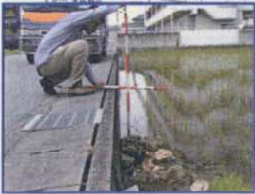
道路: 約85.1m(B.S.L 約0.7m)