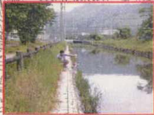
地盤面 約84.9m(B.S.L 約0.5m)