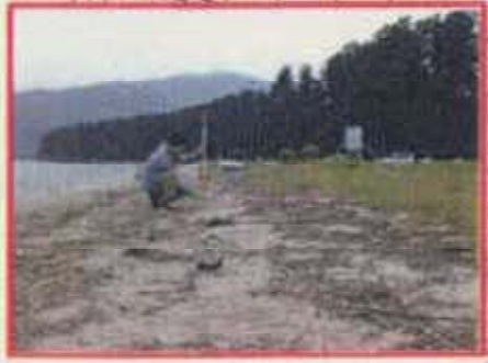
地盤高 約84.7m (B. S. L. 0.2m)