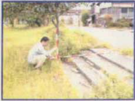
道路 約84.9m (B. S. L. 0.5m)