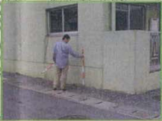
道路 約85.1m(B.S.L 約0.7m) 家屋敷高 約85.1m(B.S.L 約0.7m) 補正值 0.0m