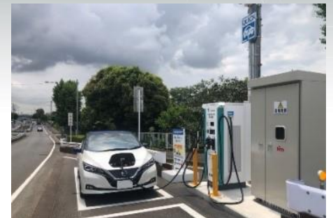
実験中の路上EV充電機器(横浜市)