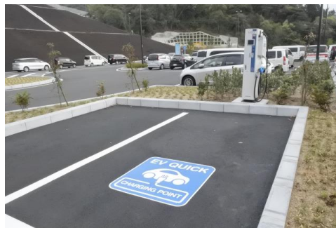
道の駅「みさき」(大阪府岬町)