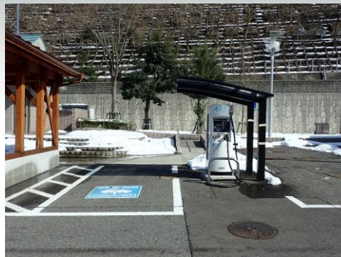
道の駅「河野」(福井県南越前町)