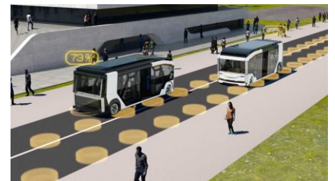
大阪・関西万博で実装が予定される走行中給電システム