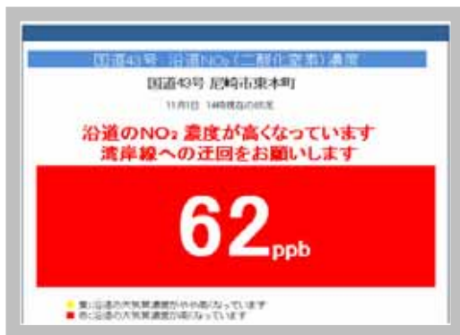
ホームページ画面