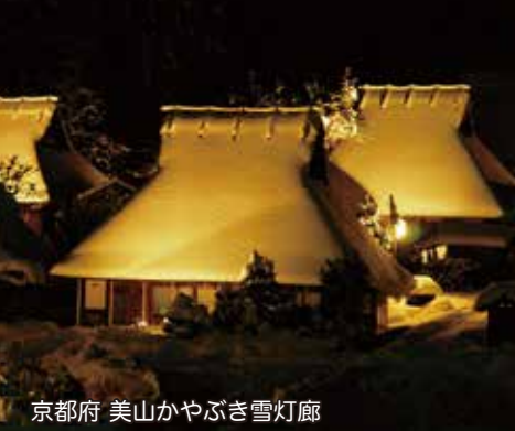
京都府 美山かやぶき雪灯廊