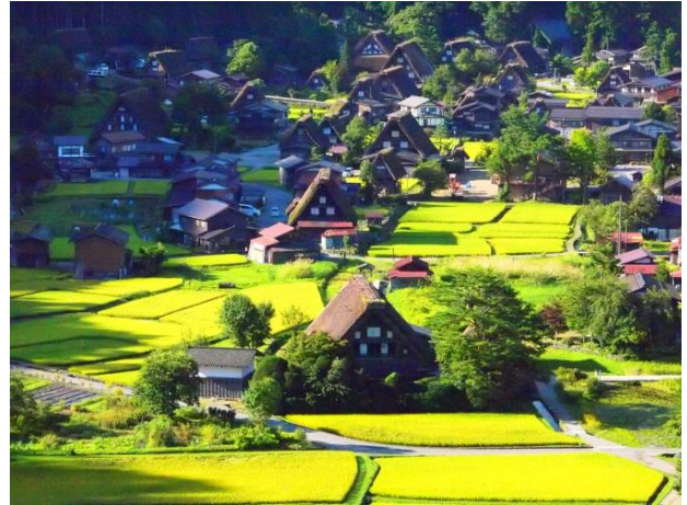
白川郷荻町合掌造り集落