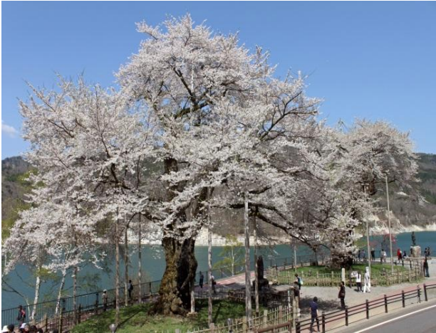
荘川桜（樹齢 500 年余）