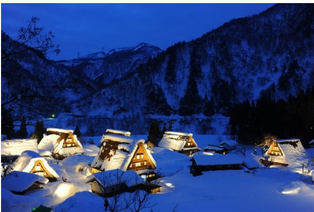
五箇山菅沼合掌集落