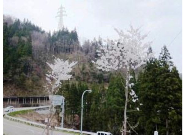
植樹活動後に開花した桜