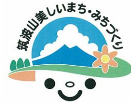
「筑波山美しいまち・みちづくり パートナーシップ」ロゴマーク

平成19年3月にロゴマーク選定会議において最優秀賞及び優秀賞(30点)を決定し、19年4月に表彰式を開催しました。