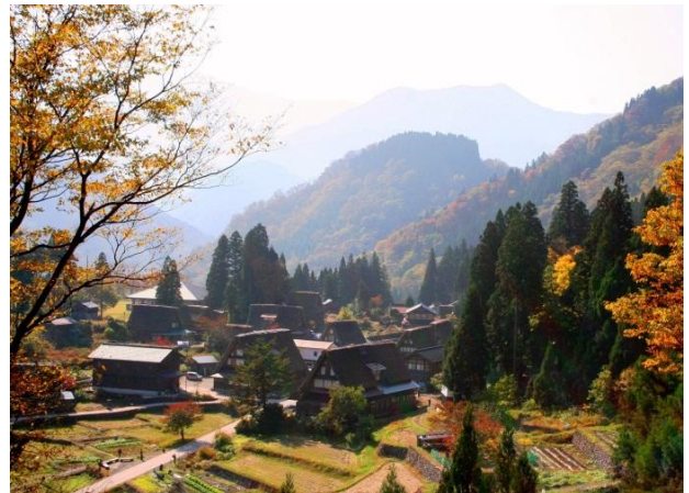
五箇山相倉合掌集落