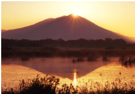
母子島遊水地 ※1 から望む筑波山

有識者や観光事業者等で構成された「筑波山ベストビューコンテスト実行委員会」の審査により、ベストビューポイント8箇所、ベストビュールート7路線、委員特別賞3地点が選定されました。