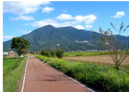
つくばりんりんロード ※2 と筑波山