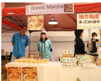
NPO 法人きもべつ WAO (支笏洞爺ニセコルート)

全国各地からの参加者に対するおもてなしメニューの目玉として、シーニックバイウェイ北海道の2ルート及びシーニックバイウェイ支援センターが「シーニックマルシェ」に出店しました。それぞれの地域の特産品やオリジナルグッズ等を販売することで各地からの参加者との交流も楽しんでいました。