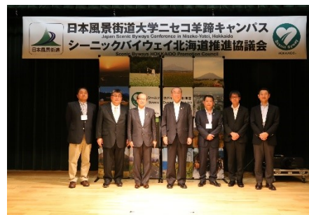
新たに候補ルートに登録された 知床ねむろ・北太平洋シーニックバイウェイ