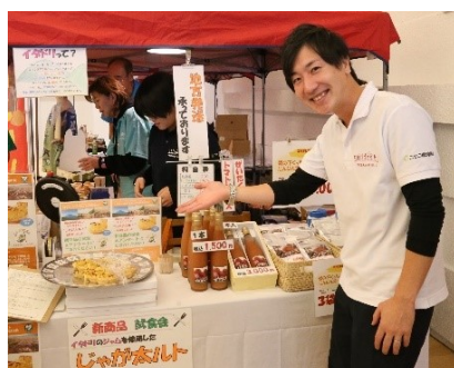
NPO 法人 WAO ニセコ羊蹄再発見の会 (支笏洞爺ニセコルート)