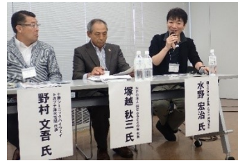
テーマ2. シーニックバイウェイとビジネス(活動の継承)の様子