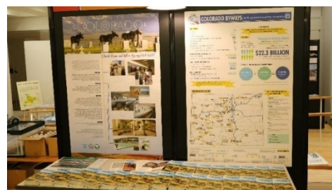
コロラドシーニックバイウェイの展示の様子

今回、パネリストとしても、ご登壇いただいたコロラドシーニックバイウェイ関係者から、温泉と歴史的資源を重要な観光資源として活用し、サンファン・スカイウェイやアルパイン・ループを中心としてコロラドシーニックバイウェイで取り組んでいる道づくりの活動等を紹介するポスターの展示とパンフレットの配布を行いました。