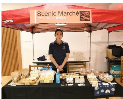
(株)ニセコリゾート観光協会 (支笏洞爺ニセコルート)