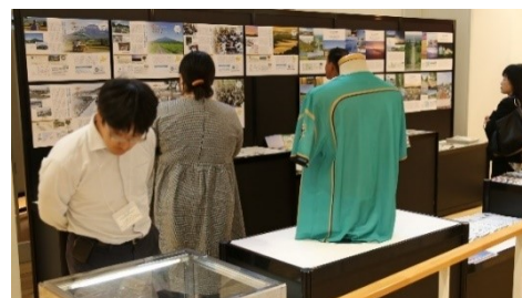
包括連携協定企業等の取組紹介の様子

シーニックバイウェイ北海道と「包括連携協定企業」及び「協力団体及び機関」の連携による、さまざまな取組を紹介するとともに、パンフレット、出版物等の各種コラボグッズを展示しました。