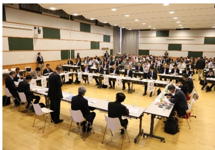
第16回 シーニックバイウェイ北海道 推進協議会 会議の様子