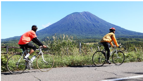
羊蹄山を背景に心地よいライド

自転車エクスカーションには、40名が参加しました。秋晴れで絶好のサイクリング日和の中、今年度新たに整備されたサイクル拠点スタート地点とし、常に羊蹄山を眺めながら、ニセコ町と真狩村、京極町の各所(約40km)を自転車でめぐり、エドポイントでは、ご当地の食や飲み物等を楽しんでいただきました。