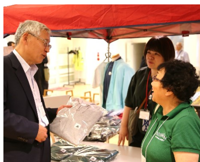
シーニック×日本風景街道コラボグッズ (シーニックバイウェイ支援センター)