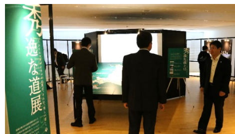
「秀逸な道展」の様子

シーニックバイウェイ北海道にて、現在試行中である全道 15 区間の「秀逸な道」の取組みについて、大型パネルや映像等を使って紹介しました。また、「秀逸な道展」の会場中央部では、シーニックバイウェイ北海道の歩みや後志地域を象徴する国道 229 号のプロモーション動画を大型スクリーン(100 インチ)に投影しました。