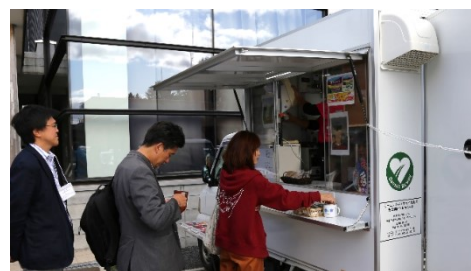
シーニックカフェの様子

道路協力団体の取組みとして、現在、支笏洞爺ニセコルートで展開中のシーニックカフェ(移動販売車)も、今回、特別に出店しました。通常販売しているソフトクリームに加え、十勝シーニックバイウェイ十勝平野・山麓ルートから、特別にブレンドされたオリジナルコーヒー「ひなたぼっこブレンド」を販売し、参加者からも大変好評でした。