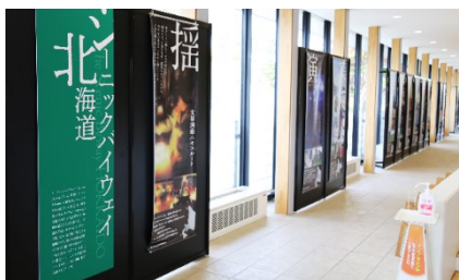
シーニックバイウェイ北海道活動紹介の様子

エントランスでは、「シーニックバイウェイ北海道」の各ルートで行われている活動を紹介するタペストリー(写真左・中央)と、シーニックバイウェイ北海道と連携した取組を進め、水辺利活用を促進し、地域づくり・観光振興に貢献している「かわたびほっかいどう」の活動について紹介するパネル(写真右)を展示しました。