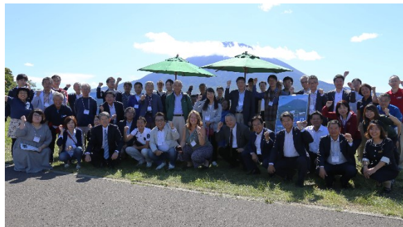
電線類の見えない化の取り組みが行われた「八幡ビューポイントパーキング」での記念写真