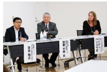
テーマ3. シーニックバイウェイと景観づくり(景観の保全と活用)の様子