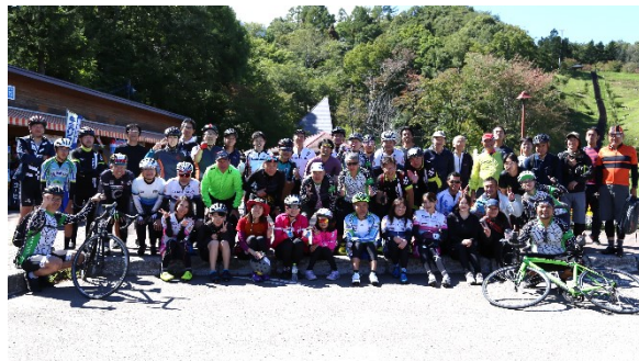
ゴールの「道の駅名水の郷きょうごく」での記念写真