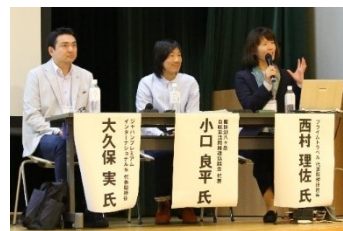
テーマ1. シーニックバイウェイとインバウンド(観光地域づくり)の様子