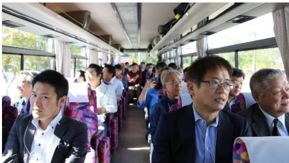
バス車中からも「秀逸な道」等の美しい景観を楽しめました

バスエクスカーションには、40名が参加し、ニセコ町のまちづくり関連施設等についてニセコ町長の片山健也氏によるガイドを受けました。また、「秀逸な道」区間や「ビューポイントパーキング(倶知安町八幡地区・喜茂別町相川地区)」では、支笏洞爺ニセコルートで行われている美しい景観を守り、育てる活動等について、地域活動団体メンバーから紹介があり、立寄り先では、越冬ニンジンジュースや枝豆等が提供されました。