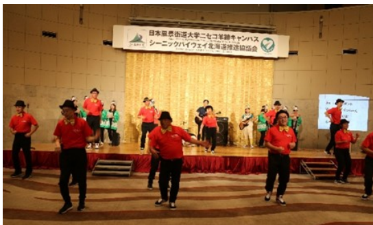
「おやじダンサーズ」とスペシャル楽団による饗宴

おもてなしステージでは、ホストルートである支笏洞爺ニセコルートの有志「おやじダンサーズ」とスペシャル楽団が交流会を大いに盛り上げました。おもてなしステージ3曲目の「365歩のマーチ」では、参加者全員が1つの大きな輪になり、その光景は圧巻でした。交流会の最後には参加者全員で記念撮影をしました。