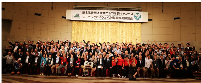
参加者全員での記念写真