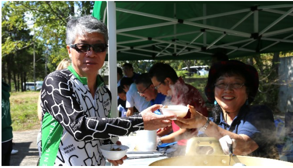
くっちゃん名物「いもっこ汁」も振舞われました