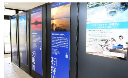
「かわたびほっかいどう」活動紹介の様子