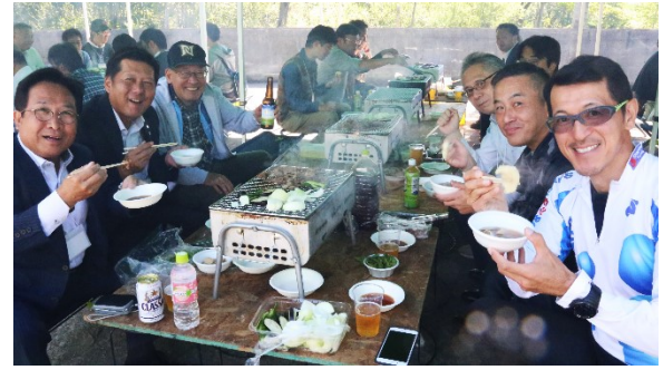
北海道らしいソバーペキューに参加者も大満足