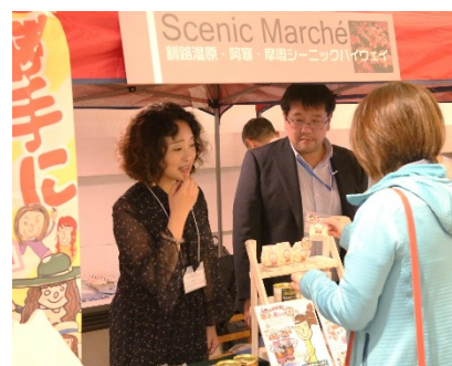
勝手におすすめ委員会 (釧路湿原・阿寒・摩周シーニックバイウェイ)