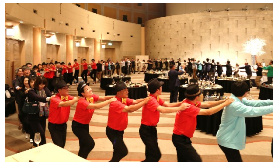
会場が一つの輪になった「三百六十五歩のマーチ」