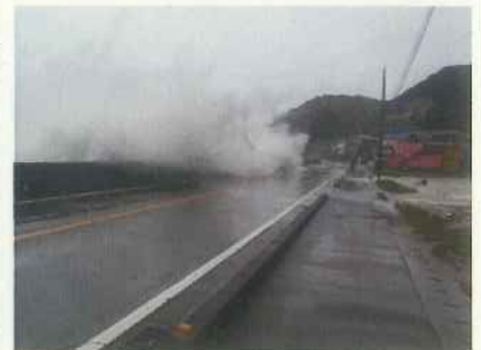
▲並行する国道42号 【台風による越波状況】