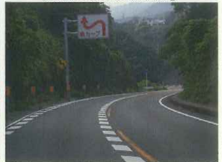
▲並行する国道42号 【線形の厳しい箇所】