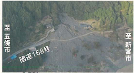
▲国道168号被災状況 (H23年9月時点)