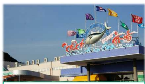
20年間で売上が約4割増 ①とれとれ市場(大型商業施設)