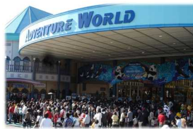
③アドベンチャーワールド