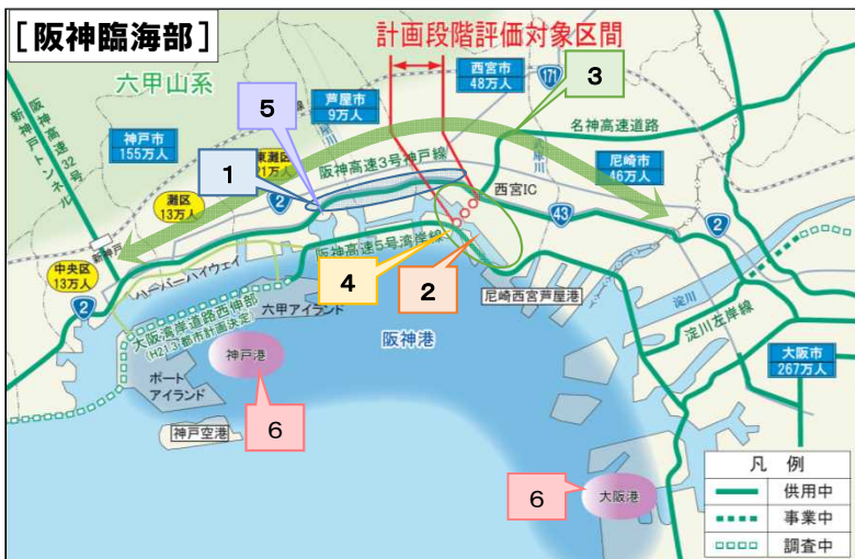
※神戸～大阪間の臨海部に位置する神戸市、芦屋市、西宮市、尼崎市を阪神臨海部として定義