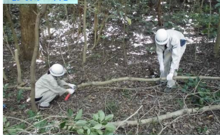
森づくり活動(2日目)