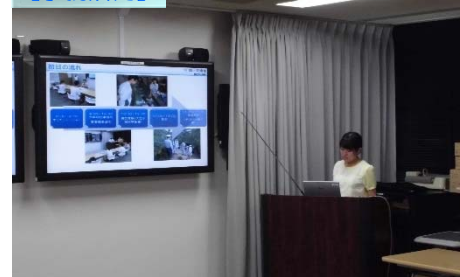
報告会の様子(5日目)