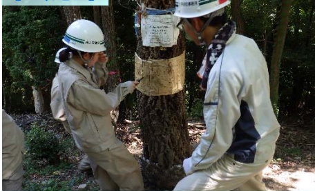
ナラ枯れ調査(4日目) AM