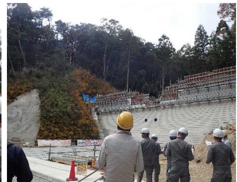
大池見山東堰堤現場(索道終点)