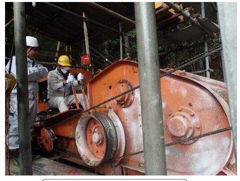
ウインチ操作中の受講生