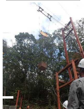
ケーブルクレーンでの資材吊り上げ