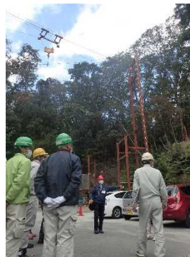
索道基地での状況

○ケーブルクレーンの操作は、危険な作業になり、重大事故も起きるので、操作に慣れると共に、玉掛作業では、荷の下にならないように十分に気をつけるなど注意がありました。