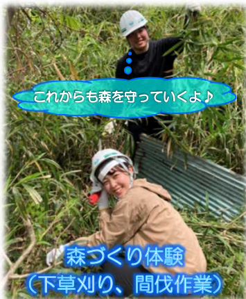
これからも森を守っていくよ♪