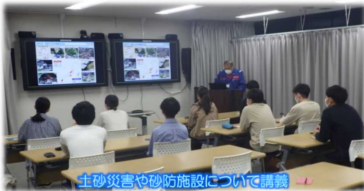
土砂災害や砂防施設について講義

※「森の世話人」とは六甲山系グリーンベルト整備事業地において、森づくりを実施しようとするNPO、または市民団体、企業等をいいます。