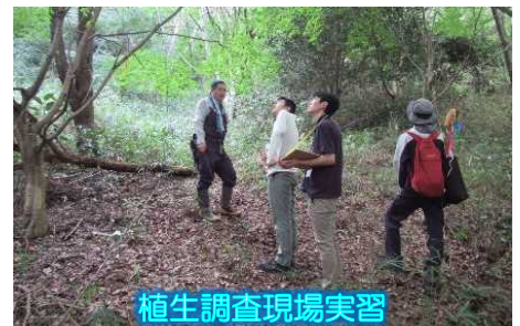
植生調査現場実習