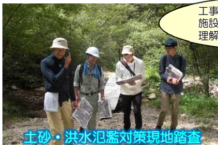
土砂・洪水氾濫対策現地踏査