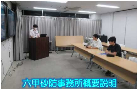
六甲砂防事務所概要説明