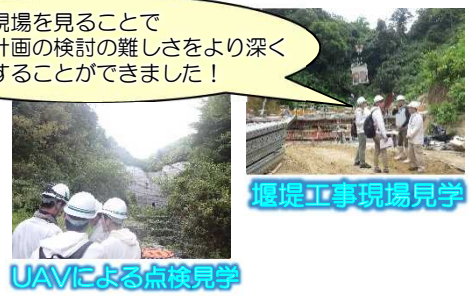
堰堤工事現場見学