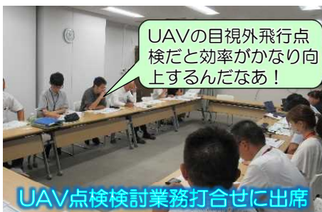
UAV点検検討業務打合せに出席