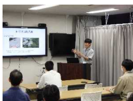
インターンシップ 報告会の様子