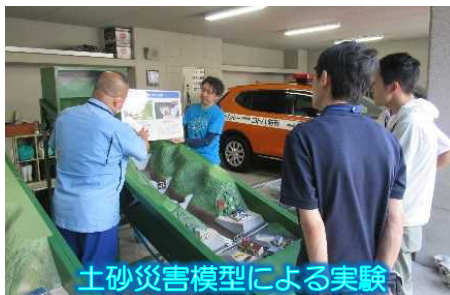
土砂災害模型による実験