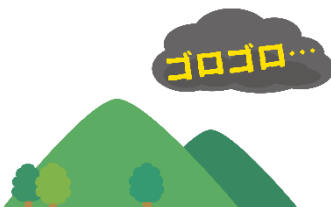
雷の音が聞こえてきた