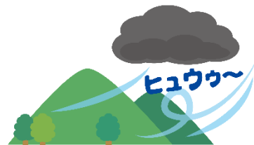
急に冷たい風が吹いてきた