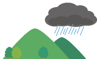
真っ黒い雲が近づいてきた