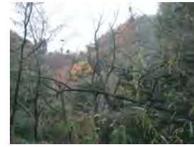
倒木したニセアカシア