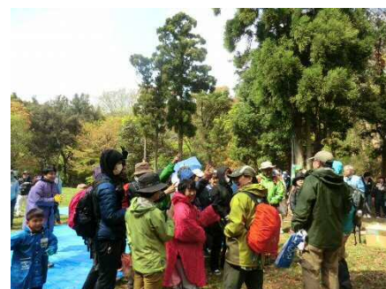
大人も子供もジャンケン大会