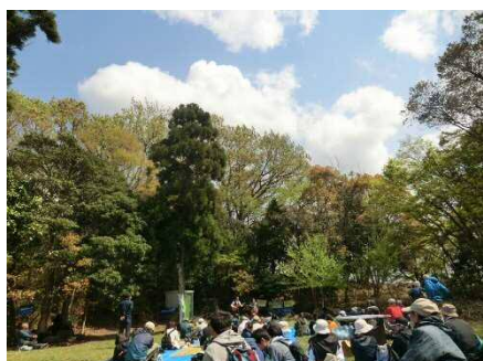
ジャズライブコンサート開始