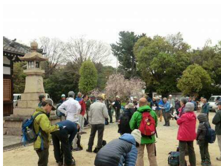
森稻荷神社境内での開会ミーティング

10班に分かれ、魚屋道尾根&神戸薬大尾根コースで森林インストラクターによる樹木教室を楽しんだ後、ジャズライブコンサートと恒例のジャンケン大会で大いに盛り上がりました。今年はハザクラでしたが、お花見会がきっかけで、身近な都市山六甲山に親しんでくださっていただければ幸いです。