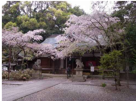
未だ綺麗な保久良神社の枝垂れ桜