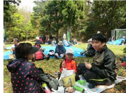
保久良夢ひろばでの楽しい昼食