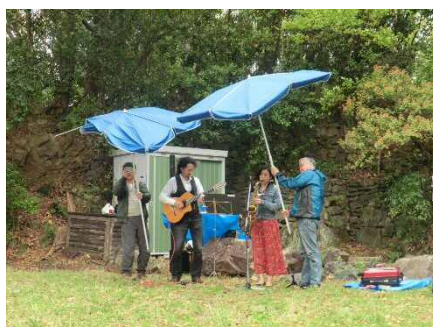
誰が呼んだか？ 俄雨