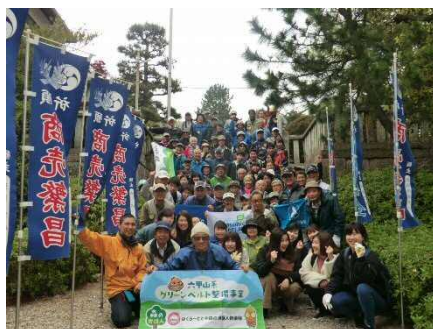
出発前の集合写真