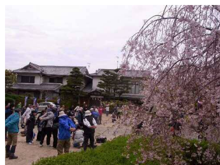
みんなで準備体操